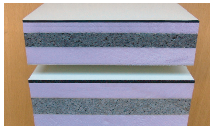
Produktreihe Füllung: 61, 87 mm Artikel: XAQA61, XAQA87

Die Platten von AV Composite und deren Verbindungssysteme unterliegen zahlreichen Patenten !